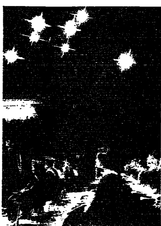
المخرج الاكبر الدكتور البشير يلقى كلمته